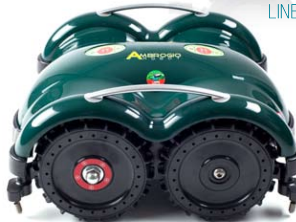
LINE 50 DELUXE