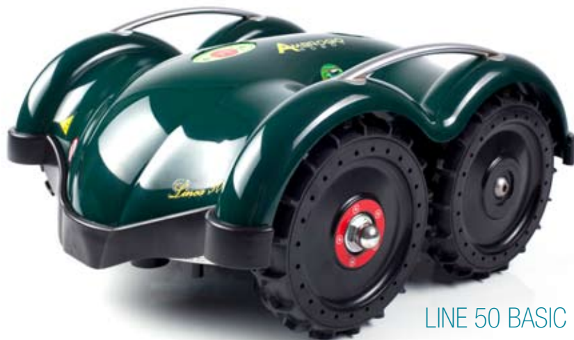
LINE 50 BASIC

Up to 800 sqm of manageable surfaces, a lithium battery incredible life.