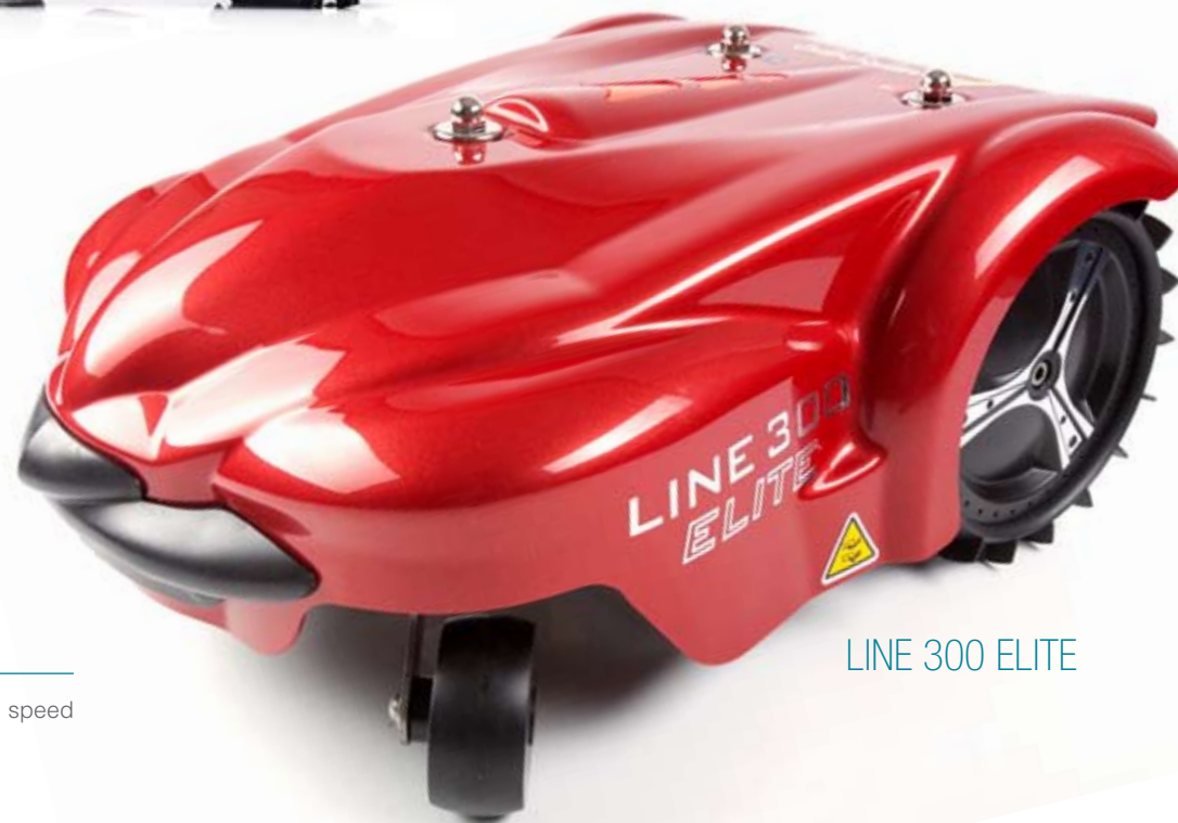
LINE 300 ELITE

La funzione Smart regola la velocità di taglio in base al tipo di prato.