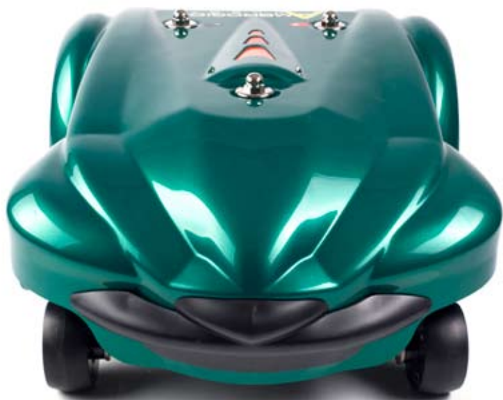
LINE 300 B

Highly performing, time-savings, silent as well as autonomous. With a further innovation: the back wheels have a profile which is conceived to improve the grip on high slopes.