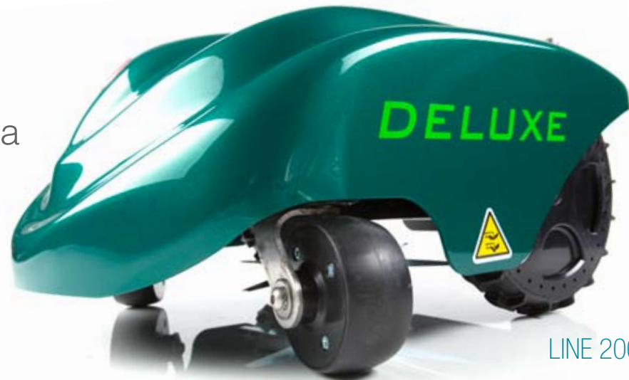
LINE 200 DELUXE

2600 mq di superficie gestibile grazie ad una batteria dall'incredibile durata.