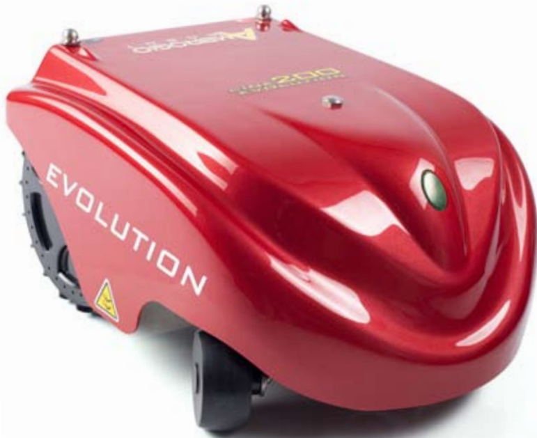
LINE 200 EVOLUTION