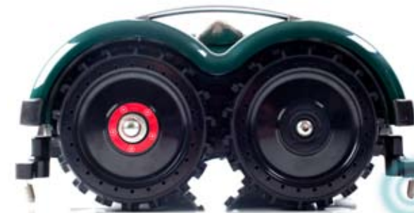
LINE 50 EVOLUTION